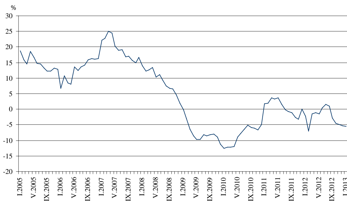
Фиг. 3. Процентно изменение на оборота в раздел „Търговия на дребно, без търговията с автомобили и мотоциклети” спрямо съответния месец на предходната година (Календарно изгледени)

През януари 2013 г. спрямо същия месец на 2012 г. оборотът намалява в почти всички икономически дейности. Най-висок спад е регистриран в търговията на дребно с битова техника, мебели и други стоки за бита - с 15.3%, а най-нисък - в търговията на дребно с разнообразни стоки - с 0.4%.